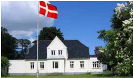
Lokalhistorisk arkiv i Seden

Seden har siden 1970'erne haft sit eget lokalhistoriske arkiv, Krogsløkkeparken 4. Her ligger utallige dokumenter om stort som småt. Er du nysgerrig eller savner du viden om Seden, så er du velkommen til at komme forbi mandag formiddag fra 9-12, hvor en af de frivillige kan hjælpe med at dykke ned i Sedens historie.